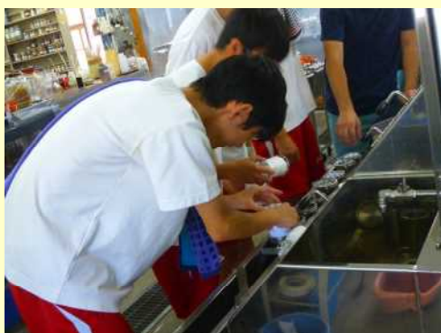
左右とも、 写真は2年生 での、インタ ーンシップ体 験の様子。

イーグルブルグマンジャパン(株)、(株)魚斎藤、神田鉄筋工業(株)、デンカ生研(株)、(株)豊寿園、(株)吉忠、 JR東日本テクノロジー(株)製造事業本部、たいまつ食品(株)、ダイニチ工業(株)、(社福)中東福祉会、 日本シイエムケイ(株)蒲原工場、(株)ブルボン新潟南工場、山隆リコム(株)、横山建設(株)、アジカル(株)、 亀田製菓(株)、(株)クボ製作所、(株)タシケント、立川ブラインド(株)新潟工場、(株)ホテルオークラ新潟、 (有)みやげ食品新潟営業所、(有)ヤスダヨーグルト、(株)雪国まいたけ、(株)カワマツ、(有)齋藤板金、 (株)レイカズン、山崎製パン(株)