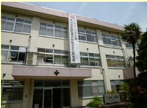
全国高等学校総合文化祭出場を知らせる懸垂幕 (インターアクト部)

昨年度、インターアクト部が8月に行われた全国高等学校総合文化祭広島大会に参加しました。