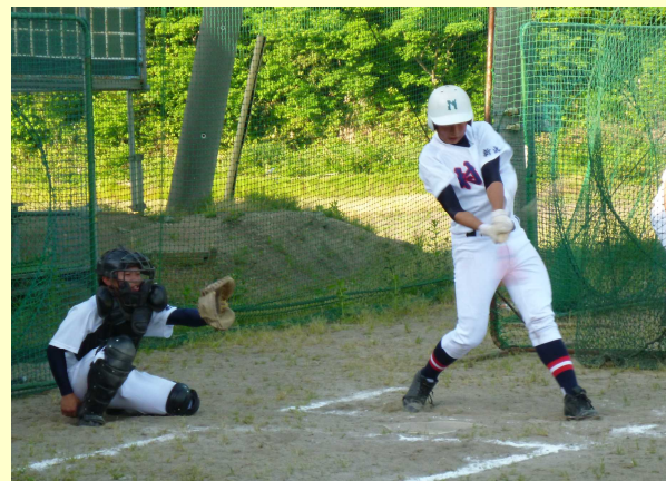
上位を目指して日々練習に励む野球部