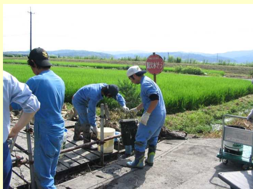
左右とも、写真は2年生での、インターンシップ体験の様子。

(株)安中製作所、イーグルブルグマンジャパン、(株)魚斎藤、(株)越配、大野精工(株)、(株)斎藤工務店、(株)佐取館、医療法人社団真仁会 南部郷総合病院、たいまつ食品(株)、デンカ生研(株)、(株)デンコー、新潟運輸(株)新潟支店、新潟染工、日本シイエムケイ(株)蒲原工場、(株)フィールドスケープ、(株)ブルボン新潟南工場、ヘアーステーションヤマザキ、(株)豊寿園、(株)ミツヒデ、(有)丸和工業、アジカル(株)、イオカ電子(株)、一正蒲鉾(株)、亀田製菓(株)、(株)クボ製作所、ダムズグループ(株)第一実業、中越運送(株)本社、新潟精密工業(株)、新潟中央水産市場(株)、(株)野島製作所、(株)北越ケース、(有)みやげ食品 名水工場、ヤマト運輸(株)新潟主管支店、(株)雪国まいたけ、渡邊工業、ゆう美容室、(株)アメリカ屋、山崎製パン(株)、(株)ワールドストアパートナーズ 名古屋事業所